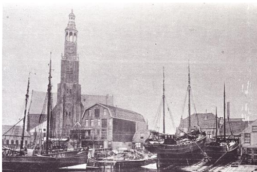
Het Schanseiland Toen en Nu

Voor inlichtingen of meer informatie kunt u de website bezoeken: www.historischewerf.nl