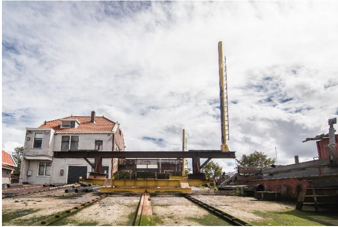
De Oude Werf

Frank Baart zit boordevol energie en ideeën. De omgevingsvergunning voor een nieuwe werfhal is ondertussen bij de gemeente aangevraagd en verwacht wordt dat deze spoedig zal worden afgegeven, waarna de werkzaamheden kunnen beginnen. De medewerkers zullen ingezet worden om de werf nieuw leven in te blazen, om mee te werken aan de nieuw te bouwen hal en verder bij alles wat nodig is om de werf tot een succes te maken. In het werk/leerproject (dagbesteding) zal plaats worden geboden aan maximaal twintig mensen. Wanneer alles meezit zal de hal